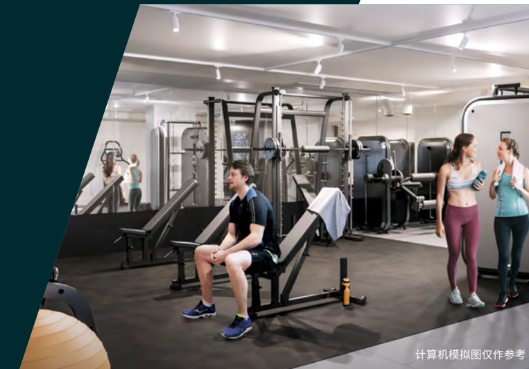
计算机模拟图仅作参考