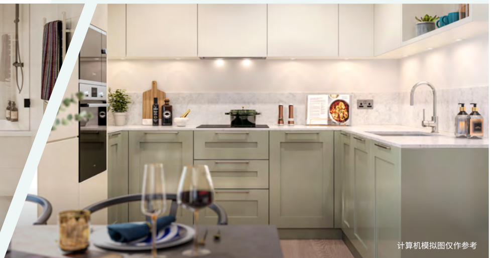
计算机模拟图仅作参考