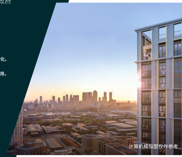
计算机模拟图仅作参考