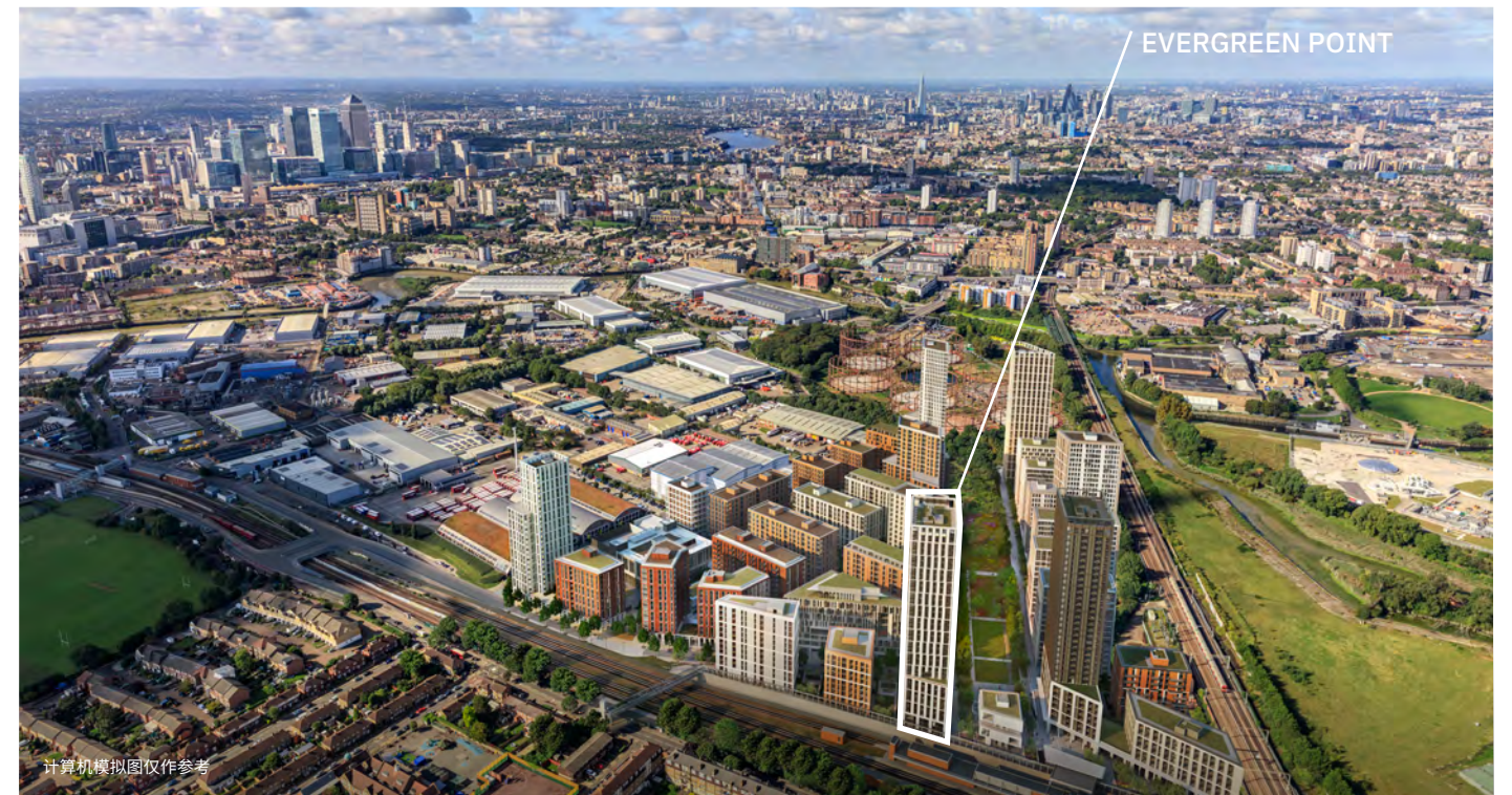
计算机模拟图仅作参考