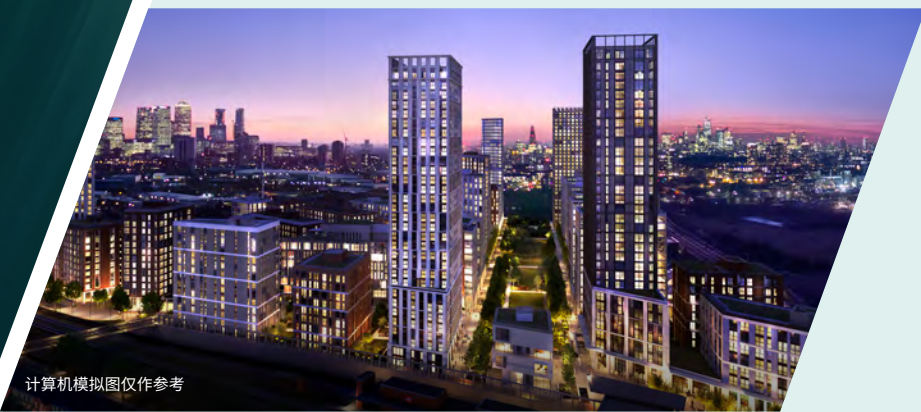
计算机模拟图仅作参考