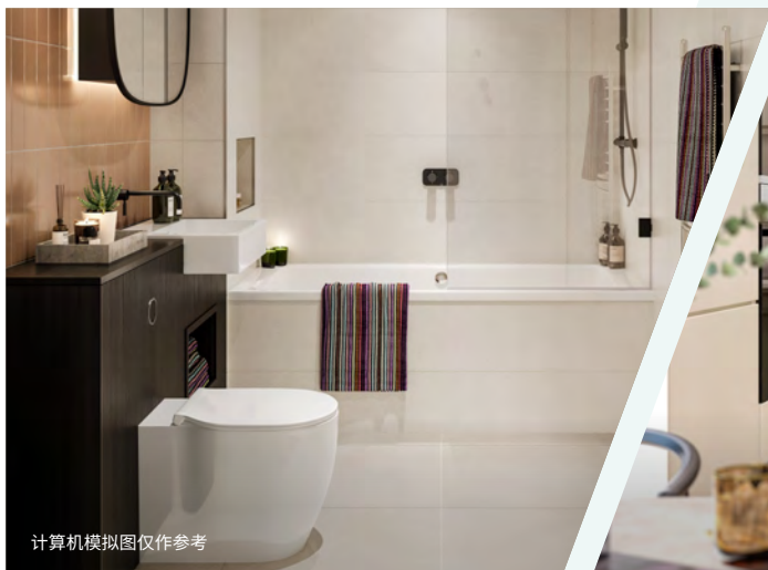
计算机模拟图仅作参考