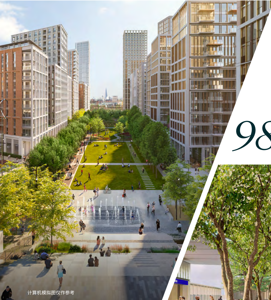
计算机模拟图仅作参考