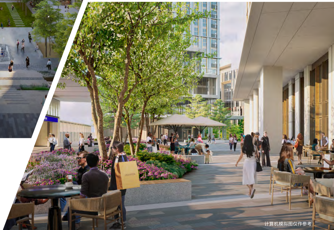
计算机模拟图仅作参考