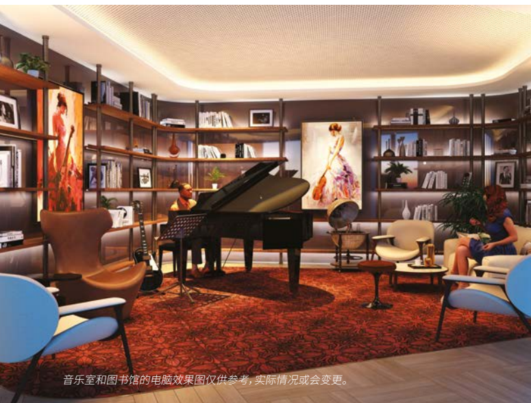
音乐室和图书馆的电脑效果图仅供参考, 实际情况或会变更。