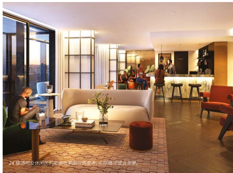
24 楼酒吧及休闲区的电脑效果图仅供参考, 实际情况或会变更。