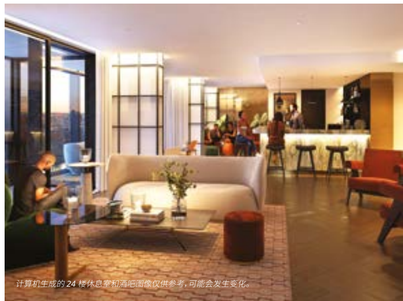
计算机生成的 24 楼休息室和酒吧图像仅供参考, 可能会发生变化。