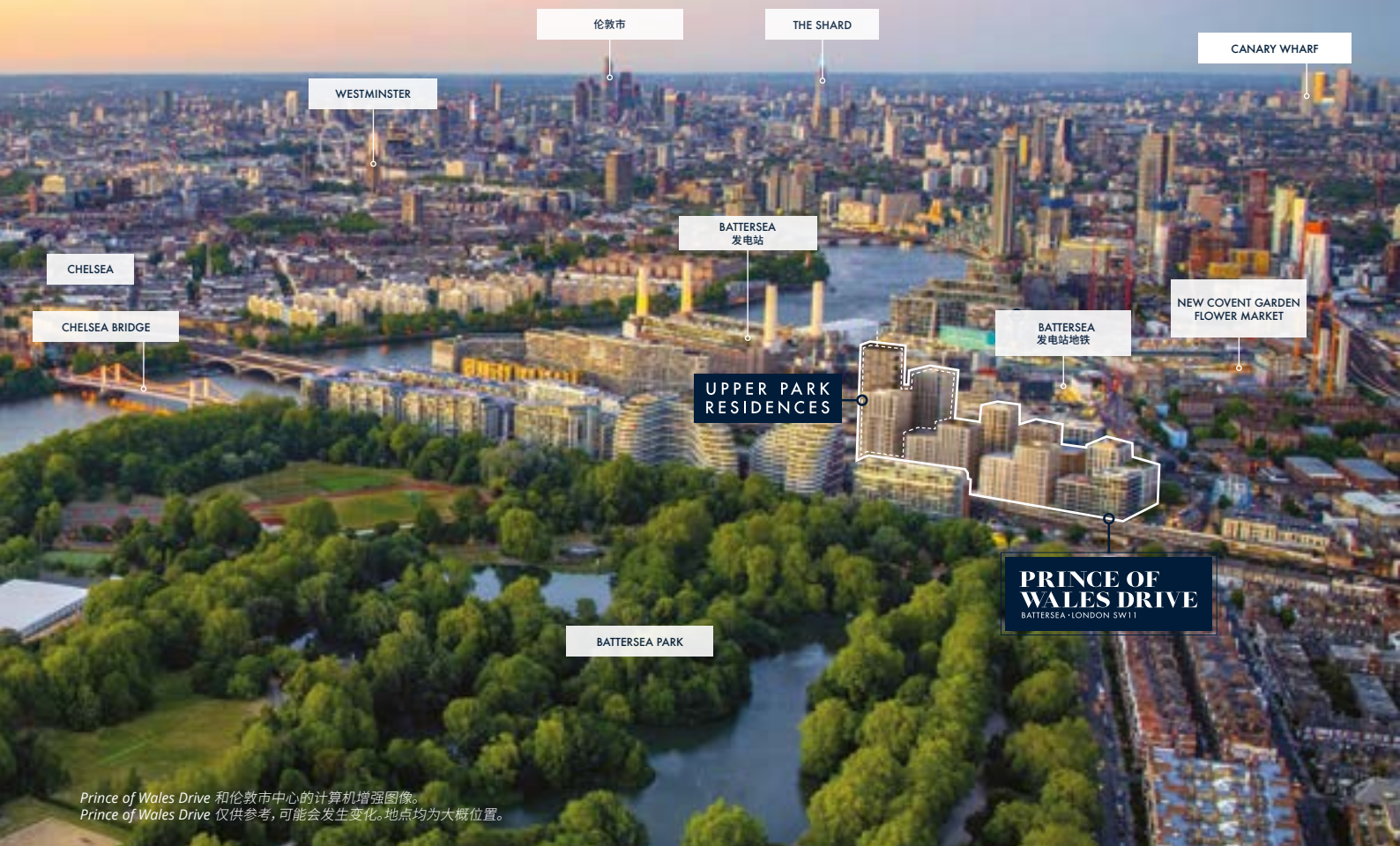
Prince of Wales Drive 和伦敦市中心的计算机增强图像。 Prince of Wales Drive 仅供参考, 可能会发生变化。地点均为大概位置。