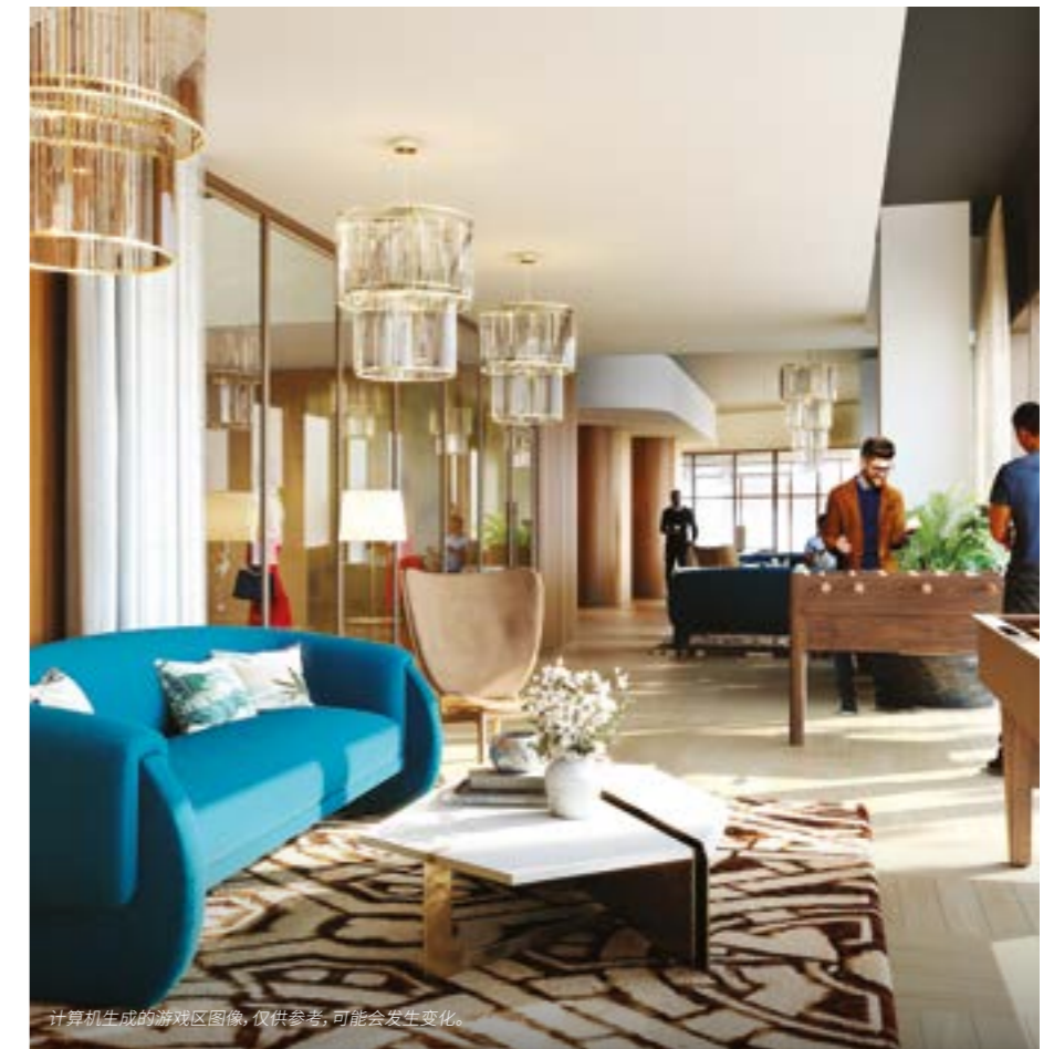
计算机生成的游戏区图像, 仅供参考, 可能会发生变化。