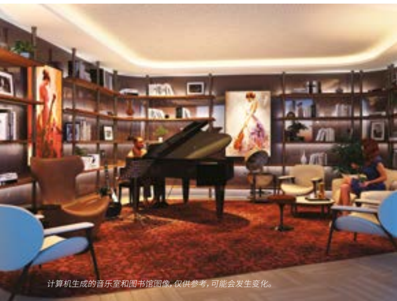
计算机生成的音乐室和图书馆图像, 仅供参考, 可能会发生变化。