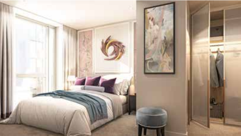
King's Road Park'ın bilgisayarla geliştirilmiş resmi yalnızca görsel amaçlıdır ve değişikliğe tabi olabilir.