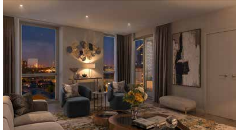
King's Road Park'ın bilgisayarla geliştirilmiş resmi yalnızca görsel amaçlıdır ve değişikliğe tabi olabilir.