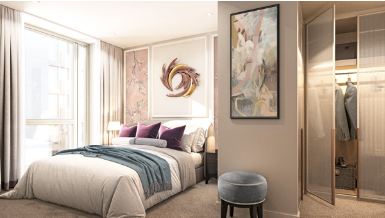
صور مصممة بمساعدة الحاسوب لتطوير كينجز رود بارك، وهي توضيحية فقط وتخضع للتغيير.