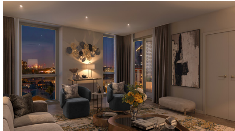
صور مصممة بمساعدة الحاسوب لتطوير كينجز رود بارك، وهي توضيحية فقط وتخضع للتغيير.