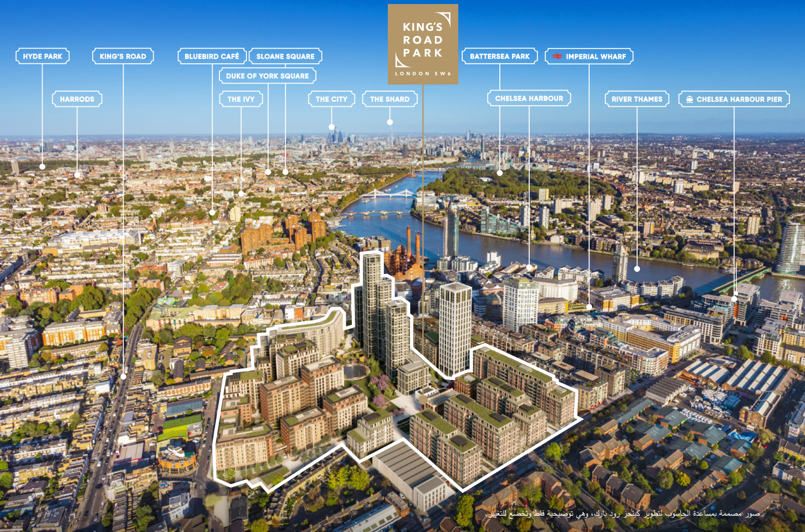
صور مصممة بمساعدة الحاسوب لتطوير كينجز رود بارك، وهي توضيحية فقط وتخضع للتغيير.