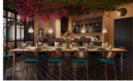
Yemek odasının bilgisayarla geliştirilmiş resmi yalnızca görsel amaçlıdır ve değişikliğe tabi olabilir.