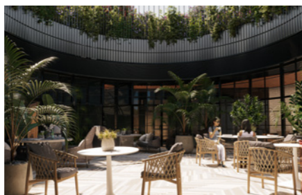
Atrium'un bilgisayarla geliştirilmiş resmi yalnızca görsel amaçlıdır ve değişikliğe tabi olabilir.