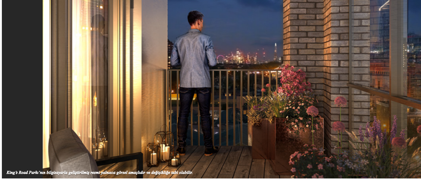
King's Road Park'ın bilgisayarla geliştirilmiş resmi yalnızca görsel amaçlıdır ve değişikliğe tabi olabilir.