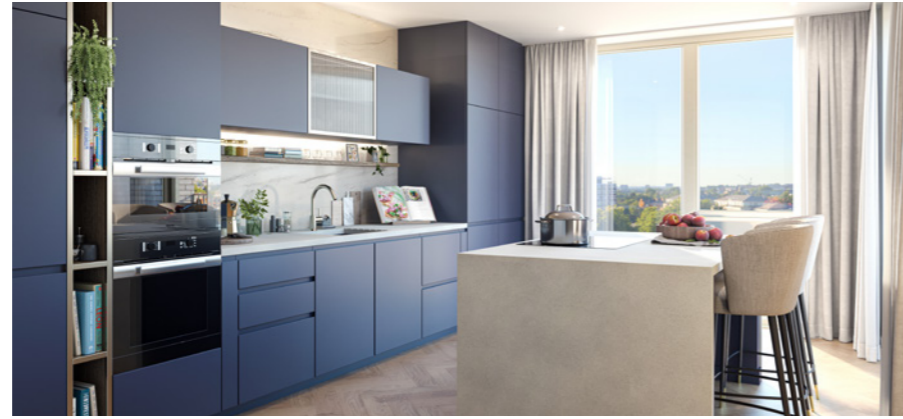
King's Road Park'ın bilgisayarla geliştirilmiş resmi yalnızca görsel amaçlıdır ve değişikliğe tabi olabilir.