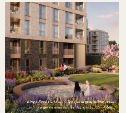
King's Road Park'ın bilgisayarla geliştirilmiş resmi yalnızca görsel amaçlıdır ve değişikliğe tabi olabilir.

İlk gayrimenkulleriniz 2022'de tamamlanmasıyla, dahil olmaya hazır mevcut bir topluluk