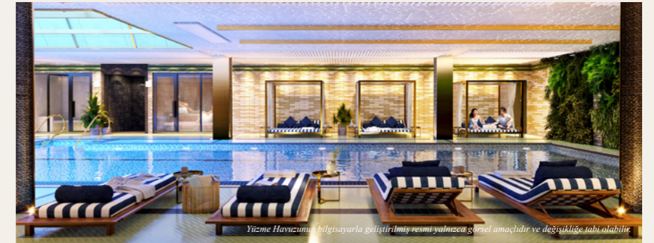
Yüzme Havuzunun bilgisayarla geliştirilmiş resmi yalnızca görsel amaçlıdır ve değişikliğe tabi olabilir.

Halka açık bir park, merkezi bir meydan ve bina sakinleri için özel bir bahçenin de dahil olduğu 2.4 hektarlık bir peyzaj alanının içinde yer almakta.