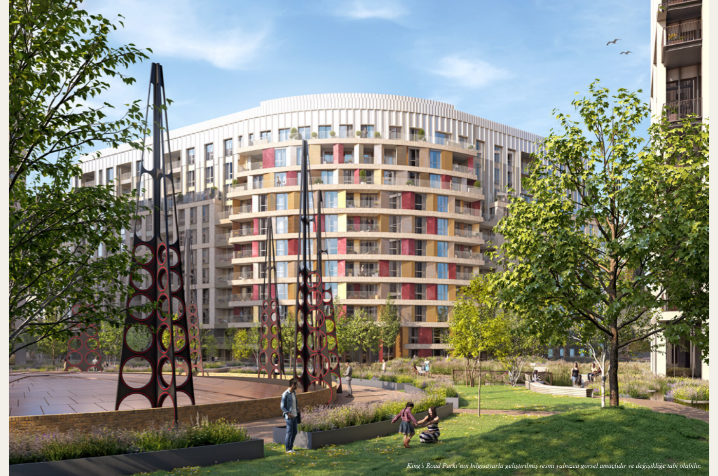
King's Road Park'ın bilgisayarla geliştirilmiş resmi yalnızca görsel amaçlıdır ve değişikliğe tabi olabilir.