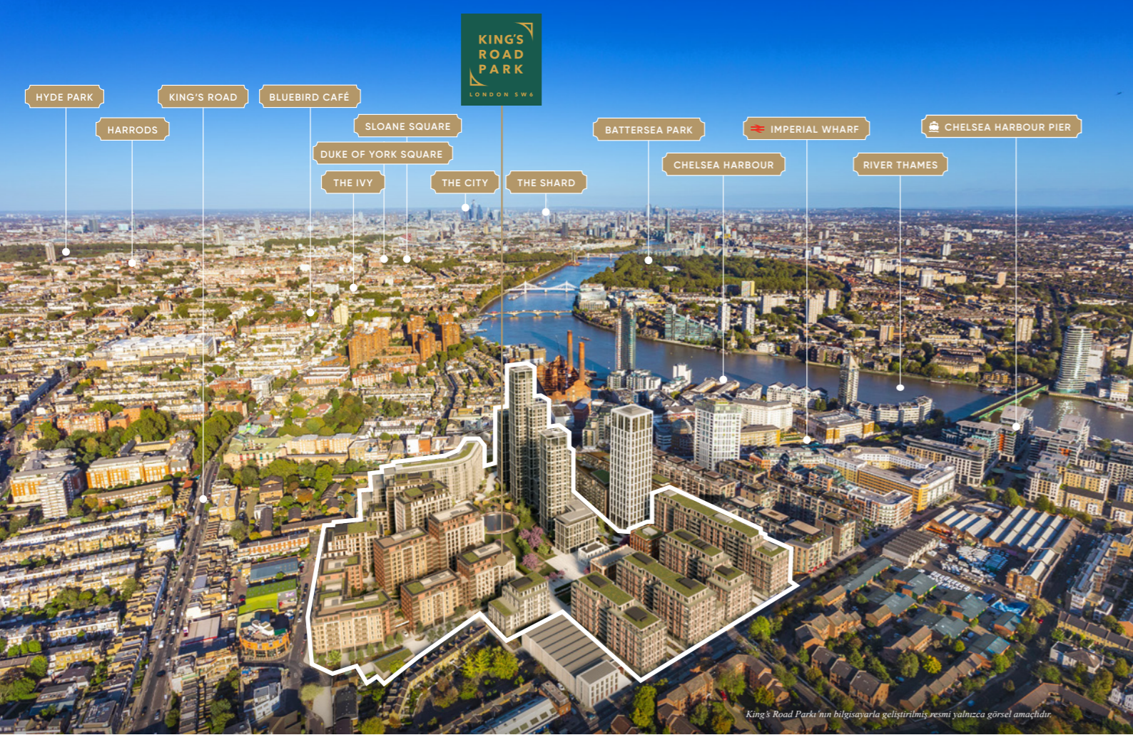
King's Road Park'ın bilgisayarla geliştirilmiş resmi yalnızca görsel amaçlıdır.