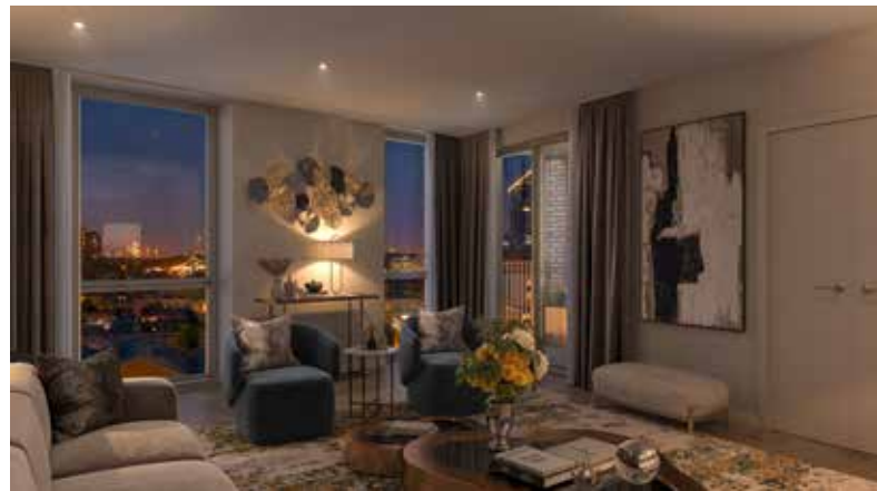
国王路花园 (King's Road Park) 的电脑模拟效果图, 仅供参考, 或会根据实际情况调整。