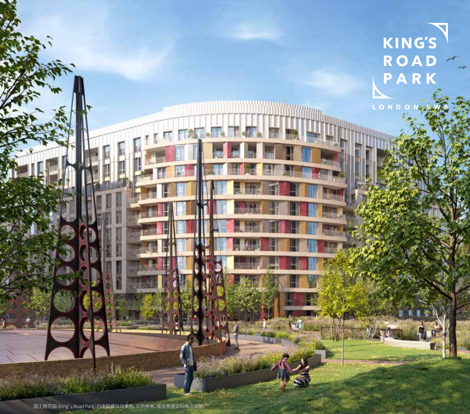
国王路花园 (King's Road Park) 的电脑模拟效果图, 仅供参考, 或会根据实际情况调整。