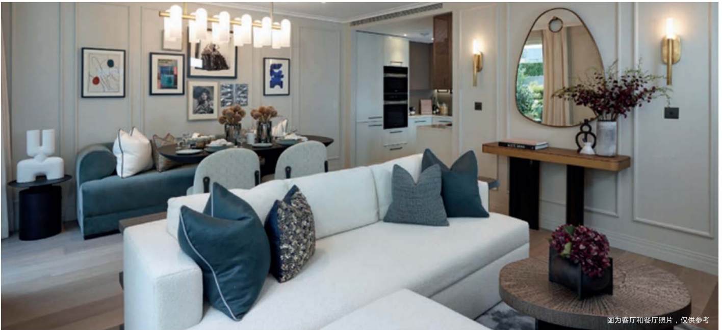
图为客厅和餐厅照片，仅供参考