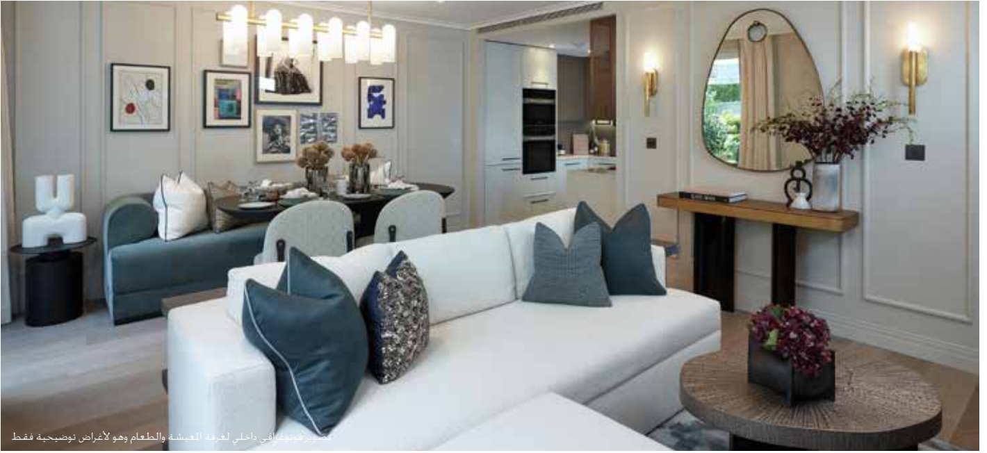
تصوير فوتوغرافي داخلي لغرفة المعيشة والطعام وهو لأغراض توضيحية فقط