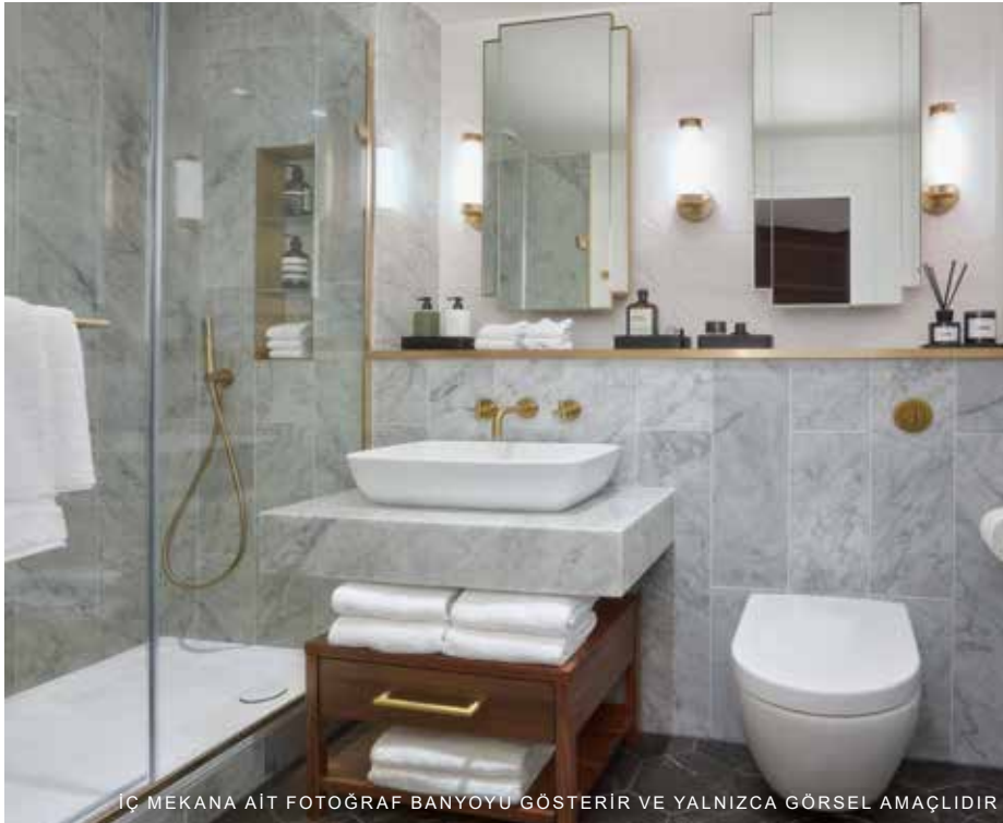
İÇ MEKANA AIT FOTOĞRAF BANYOYU GÖSTERİR VE YALNIZCA GÖRSEL AMAÇLIDIR

*Tahmini hizmet ücreti yalnızca itibari bir değerdir ve değişikliğe tabidir. İtibari değer 08/20 tarihidir ve hazırlık aşamasından yasal tamamlama aşamasına kadar olan sürede ortaya çıkabilecek perakende fiyat endeksi, enflasyon v.b. artışları kapsamaz. Hizmet ücretini etkileyebilecek değişiklik koşulları, bunlarla sınırlı olmamak üzere, sektörde veya devlet kanunlarındaki değişiklikleri, beklenmeyen masrafları ve St George'un kontrolü altında olmayan diğer her türlü hususu içermektedir. Alanmış Yönetici Acente, ruhsatlar ve izinler, devren kiralama, yasal prosedürler ve yeniden satış/satış paketi dahil ancak bunlarla sınırlı olmayan öğeler için, hizmet ücretinin dışında ilave ücretler tahsil edebilir.