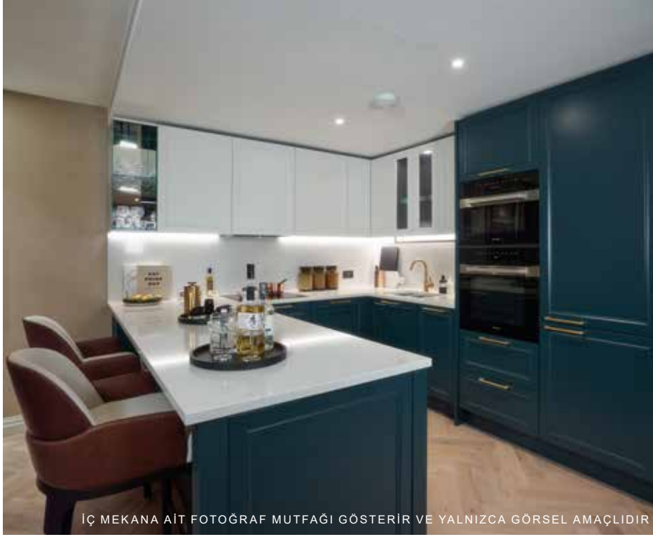
İÇ MEKANA AIT FOTOĞRAF MUTFAĞI GÖSTERİR VE YALNIZCA GÖRSEL AMAÇLIDIR