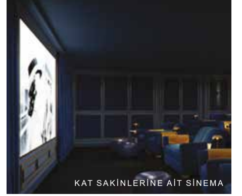
KAT SAKINLERİNE AIT SİNEMA