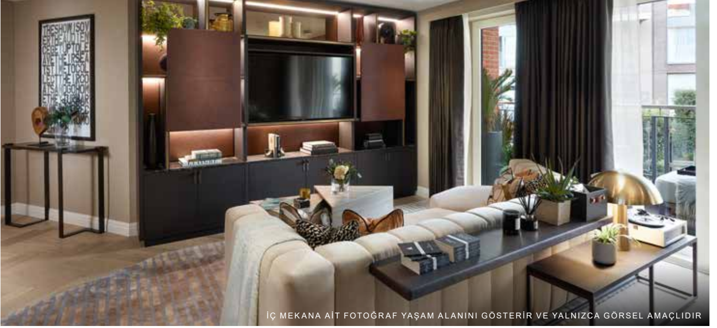
İÇ MEKANA AİT FOTOĞRAF YAŞAM ALANINI GÖSTERİR VE YALNIZCA GÖRSEL AMAÇLIDIR