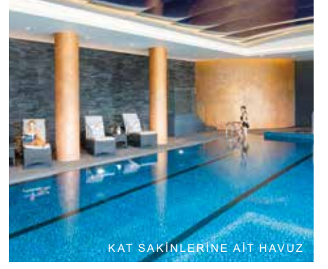
KAT SAKINLERİNE AIT HAVUZ